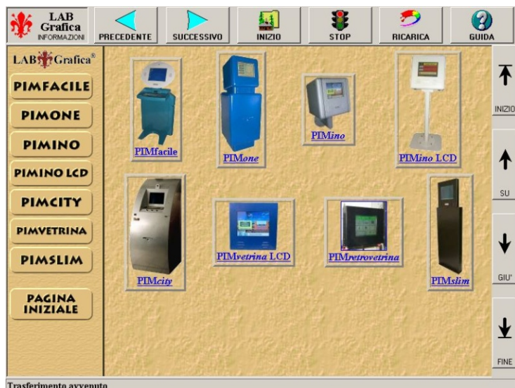
Finestra del browser Fingernet

Si tratta di un browser con interfaccia di navigazione semplificata che permette di rendere accessibile Internet anche all'utente inesperto tramite Touch Screen e Tastiera virtuale.